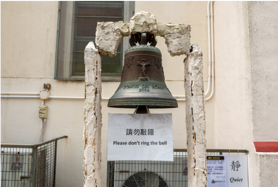
鹽田梓小堂（南門）外的小銅鐘

中國傳統宗教建築，在主殿前面，設有鐘樓鼓樓，主殿多是座北向南，鐘樓和鼓樓分別東方和西方，早上先敲鐘後擊鼓，黃昏則相反，先擊鼓後敲鐘。晨暮時分敲鐘打鼓，是廟宇召集僧徒修行的信號，傳送覺醒，早晚報時，也是提醒人們生活作息。暮鼓晨鐘，音頻回蕩，扣人心弦，有一種使人警醒的能量。 77