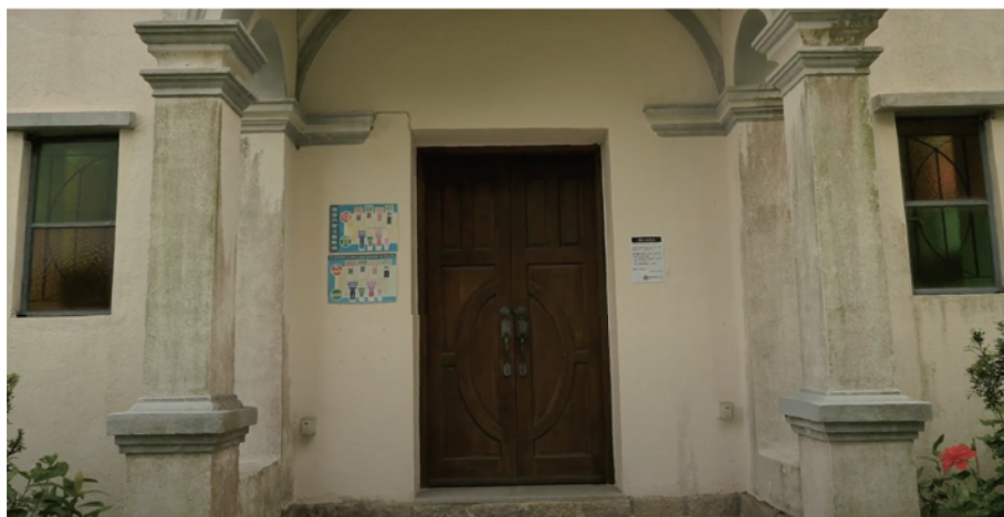
正門：為何面向東方？